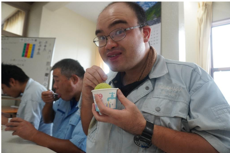
買い求めた利用者さんから順に食堂休憩室でいただきました