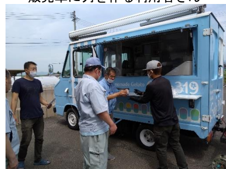
ジェラートを受け取る利用者さん

7月21日、社会福祉法人あぶくま福祉会の35回目の創立記念日を迎えました。あぶくま福祉会では創立記念祝賀事業として「ジェラートのつどい」を7月19日に、ほとほら授産所とだての郷でそれぞれつどいを行いました。