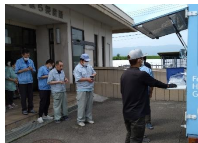
販売車に列を作る利用者さん