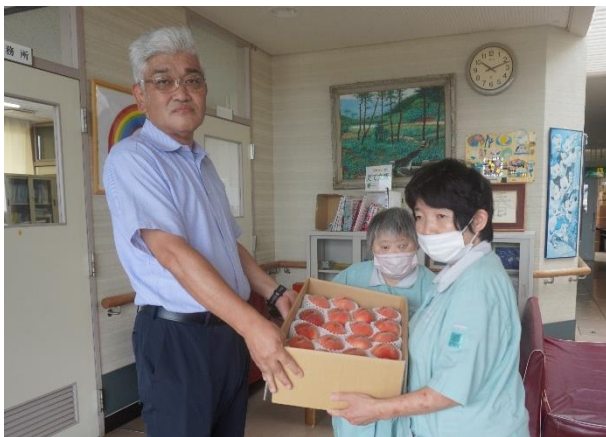
7/26 長沢営農センター長さんから桃をいただく 利用者代表㊦

JAふくしま未来伊達地区本部様から、今年もだての郷とほどはら授産所に桃をご寄贈いただきました。7月13日、ほどはら授産所と、だての郷の利用者代表が保原認定こども園に出向き、いただいてまいりました。頂戴した桃はその日の午後、帰りの会で利用者さんにお渡しし、ご自宅でお家の方々と召し上がっていただきました。