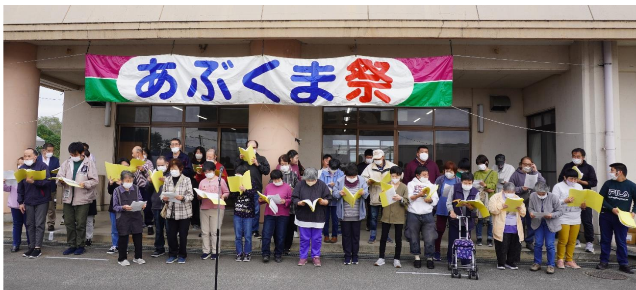
利用者さんと保護者さんがいっしょにコーラス