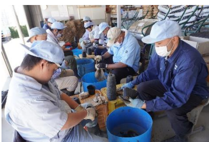
ポットの洗浄をする利用者さんたち