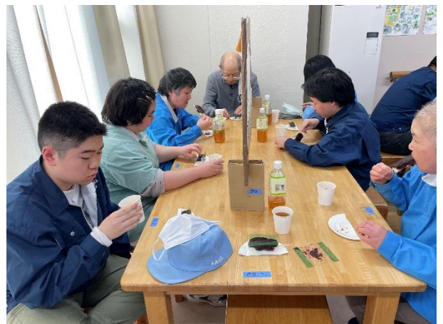
団子をいただく利用者さんたち

10月15日、先月の中秋の名月お月見会に続いて、十三夜のお月見会を開きました。この日は旧暦9月13日のお月見で、中秋の月だけのお月見では「片見月」と言って昔から縁起が悪く、災いが起こると言い伝えられており、縁起を担ぎ両方見るよう「十三夜のお月見会」を開きました。