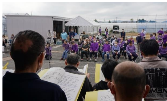
ほどはら授産所の発表を聞く客席の皆さん（写真奥）