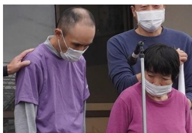
開会のことばを述べる利用者さん