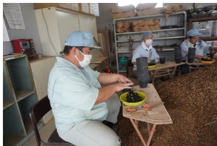
ポットに苗を植栽する利用者さんたち