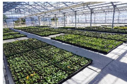
ハウスの中で花苗を育てています