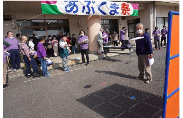
ニュースポーツコーナーでは多くの皆さんがポッチャやフライングディスクを体験しました