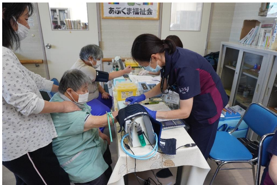
労働保険センター職員に採血と血圧測定をしてもらう利用者さん (写真中央)

要な方は病院の受診をお願いします。普段の生活が病気の原因を引き起こしている可能性もあります。この健診結果をきっかけに自身の生活を見直し、健康づくりに心がけてほしいと思います。