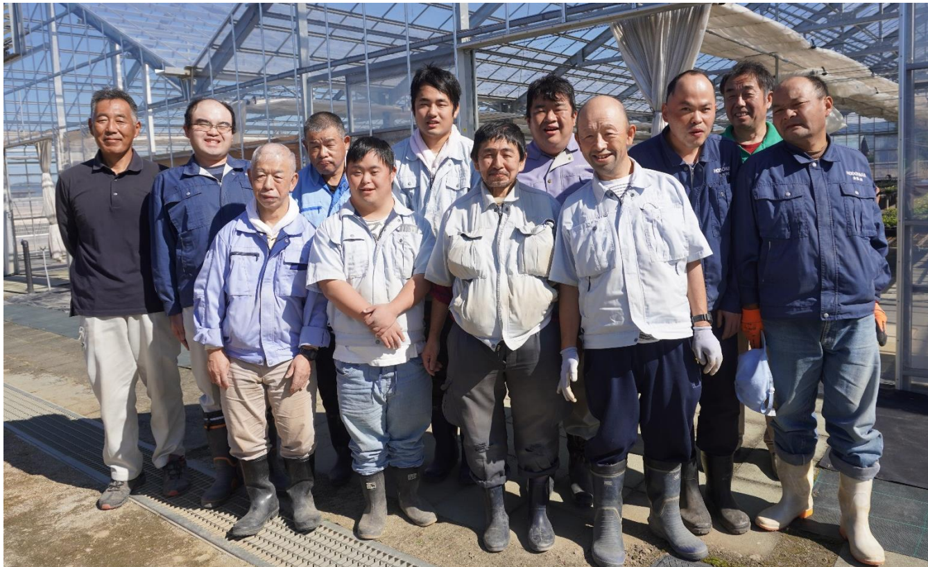
花苗の生育に一生懸命に取り組む農耕園芸班の皆さん

農耕園芸班の作業は、花苗の育成と苗の販売です。種まきから苗の育成、ポット植え替え、花苗ポットの販売まで一貫して行っています。