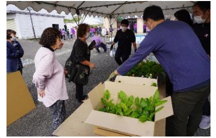
授産品販売コーナーで花苗を購入する保護者会の皆さん